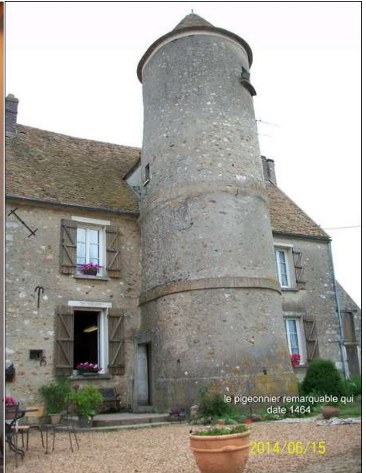
le pigeonnier remarquable qui date 1464